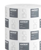
460058 Katrin Plus Torkrulle M till Dispenser System 445 Ark 2-Lagers