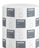
38015 Katrin Plus Torkrulle till Dispenser System 3-Lagers