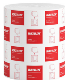
460102 Katrin Torkrulle M till Dispenser System 2-Lagers