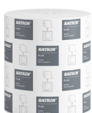
82537 Katrin Plus Dispenser Paper Towel Roll System